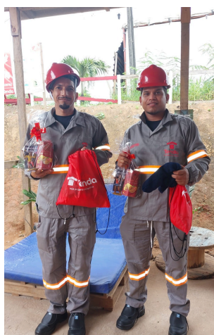
Profissionais venezuelanos em Pernambuco.

O Sistema Fiep, por meio do programa Indústria Acolhedora, realizou em agosto uma ação de capacitação voltada para as lideranças de uma indústria da área frigorífica. O programa, que apoia as indústrias com o propósito de promover a inclusão de pessoas refugiadas e migrantes no mercado de trabalho, ofereceu formação para 130 lideranças nas plantas dos municípios de Terra Boa e Paraíso do Norte, no norte do Paraná. A capacitação, operacionalizada pelo Instituto Euvaldo Lodi - IEL, teve como objetivo preparar essas lideranças para acolher e integrar as pessoas venezuelanas que foram contratadas por meio da Operação Acolhida. Indústrias interessadas em saber mais sobre o programa podem preencher o formulário neste link .