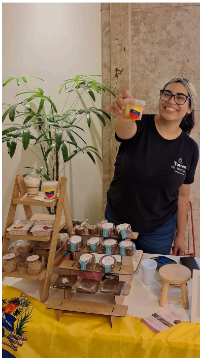
Feira com refugiados empreendedores